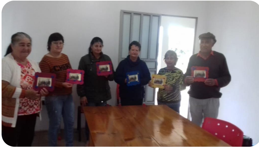
Intergeracional - Círculo de Experiências